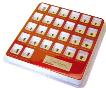
25号に付くビスサンプル

25号の本誌には、提供されるすべてのビスがひと目でわかるビスサンプルが付いてくるが、ここでは各タイプの特徴をより具体的に説明しよう。サンプルと併せて活用すれば、間違いやすいビスの整理・確認に非常に便利だ。