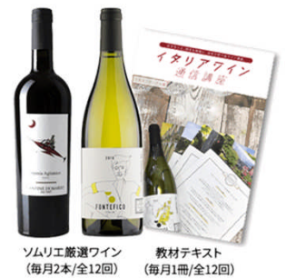
ソムリエ厳選ワイン (毎月2本/全12回) 教材テキスト (毎月1冊/全12回)

株式会社デアゴスティーニ・ジャパンは、ソムリエ厳選のイタリアワイン2本とイタリアワインを体系的に学ぶことができるマガジンを全12回のシリーズでお届けする「イタリアワイン通信講座」のお申込み受付を開始いたしました。毎月お送りするマガジンとワインで、イタリアワインの文化・歴史・生産地域など、イタリアワインならではの“個性”や“多様性”を楽しみながら体験することができます。またワインに関する一般的な基礎知識も12回のシリーズを通して学ぶことができます。シリーズお申込みは2020年8月末まで、9月よりお届けスタートです。