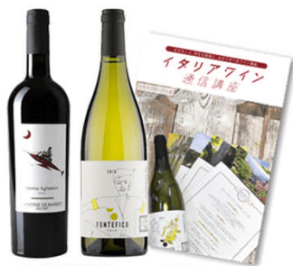
ソムリエ厳選ワイン (毎月2本/全12回) 教材テキスト (毎月1冊/全12回)

「イタリアワイン通信講座」は500名様限定で9月末よりスタートする12か月継続のコースになります。お支払いは月額9,800円 (+税) × 12回。また一括払い117,600円 (+税) でお申し込みされた方限定で「ワイングラス4脚セット」をプレゼント！美しいフォルムが生み出す高級感とボリューム感で、ワイン講座の学びに奥行きが生まれます。※未成年者の飲酒は法律で禁止されているため、20歳未満の方はお申し込みいただけません。