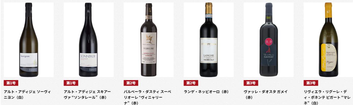
第1号 アルト・アディジェ ソーヴィニオン (白)

「イタリアワイン通信講座」でお届けするワインは全24本。どのワインもイタリア最優秀ソムリエ賞を受賞したソムリエが直接イタリア現地の生産者を訪れ仕入れたこだわりのラインナップ。中には日本ではなかなか流通しない珍しいワインも。一緒にお届けするマガジンには各ワインのテイastingシートを模範解答付きで掲載。初心者でもわかりやすくワインの個性を知ることができます。