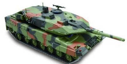
第 4 号付属タンク 【レオパルト 2 A5】 ドイツ 2003 年