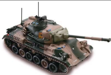
第 2 号付属タンク 【61 式戦車】 日本 1993 年