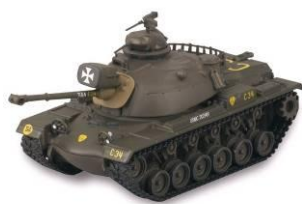
第 3 号付属タンク 【M48A3 パットン 2】 アメリカ 1968 年