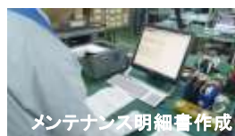
メンテナンス明細書作成