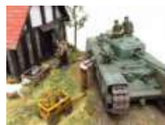
【準グランプリ《AFV部門》】 Liberation de la France! 1944 ●おやジさん / 熊本県