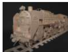
【準グランプリ《その他作品部門》】 木製 蒸気機関車 C62 ●TomTomさん / 岐阜県