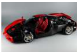
【準グランプリ《自動車部門》】 1/12 ENZO FERRARI "CUT MODEL" ●チゼータさん / 神奈川県