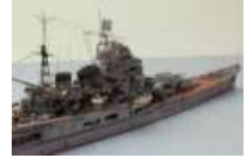
【準グランプリ《艦船部門》】 日本海軍重巡洋艦「摩耶」