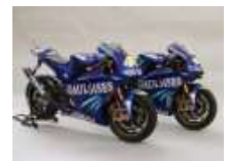
【準グランプリ《バイク部門》】 04 YZR-M1 No.46 & No.17 ●つっちーさん / 東京都