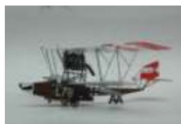
【準グランプリ《飛行機部門》】 ローナーL オーストリア 水上戦闘飛行艇 ●柏木光雄さん / 茨城県