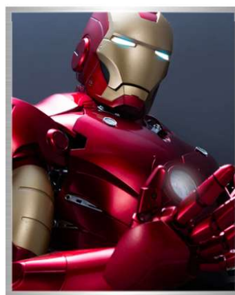
※4つのポーズは週刊「アイアンマン」の完成品プロトタイプを用いて撮影しております。