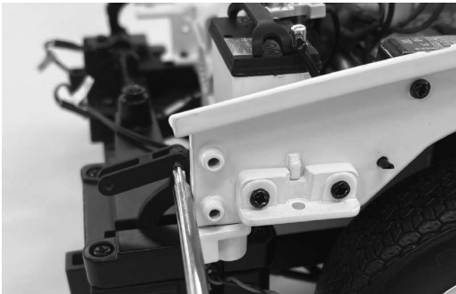
※NPネジを締めるのに十分な角度の目安