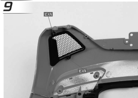
写真の2カ所に「ビス X (2.0×3mm-M)」を締め、54-3 (リアバンパーベント・左)を固定する。

しかしその発生率が不明なため、 ネジの長さを4mmにした「ビス K (2.0×4mm-M)」5本を今号に同梱いたしましたので、 ネジ留めが出来ない場合にはこちらのネジで組み立てていただきたくお願いいたします。