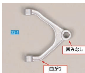
「32-1 アッパーアーム・右」