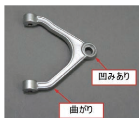
第32号提供パーツ 「31-1 アッパーアーム・左」