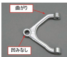
第31号提供パーツ 「32-1 アッパーアーム・右」