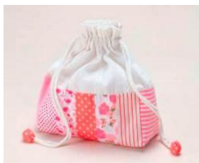
ランジェリーポーチ