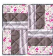
1号 レールフェンス