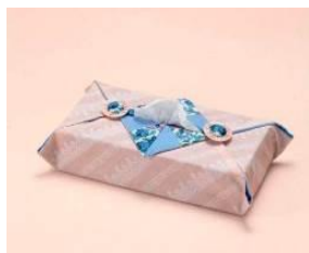
ティッシュボックス カバー