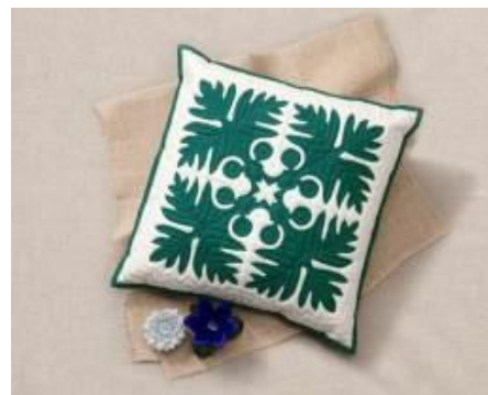
パンの木の クッション