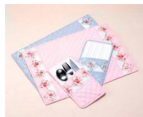
ランチョンマット& カトラリーケース