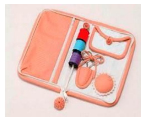
ソーイングケース