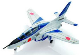
▲ T-4 中等練習機