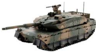
▲ 10 式戦車