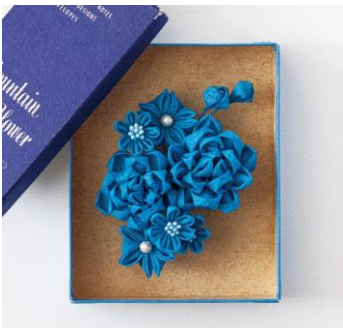
ターコイズブルーのコサージュ

「四季のフラワーリース」で作る花の応用で作れるブローチなどのアクセサリや、生活に役立つ小物雑貨を数号で仕上げていきます。小物作りはちりめん、コットン、リネンなど、さまざまな布を使用するコサージュ、ペンダントヘッドやリングなど、日常使いできるアイテムが登場予定です。