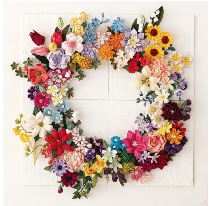
四季のフラワーリース

ブーケを飾る白いボードは20cm×20cmサイズで、計4枚がキットとしてシリーズに付属します。