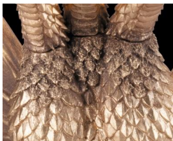
キングギドラ (胸部)