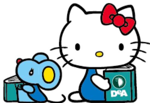
ジョーイと一緒に本を読むキティちゃん

【画像素材ダウンロードURL】 https://deagostini.box.com/s/ex0tbnw78htqf2sx9knssttiv9e98ld4