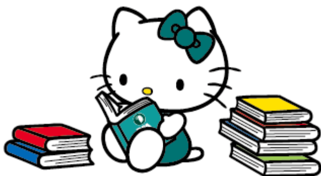
読書大好きなキティちゃん