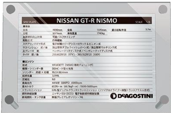
スペックスタンド

創刊号～第40号をご購入頂いた方、全員にオリジナルアイテム2点セットをプレゼントします。