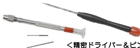
〈精密ドライバー&ピンバイス〉 3号に付属

精密ドライバーやピンバイスなど、基本の工具の一部は制作課程に合わせて随時本誌に付属します。